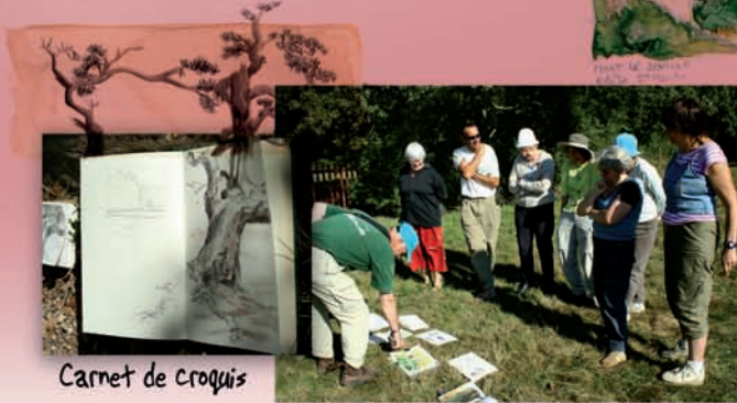
Carnet de croquis

Des évaluations régulières par le peintre vous aideront à mieux comprendre comment traiter votre sujet et passer de la réalité à une composition originale et indépendante.