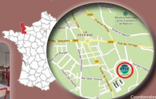
Plan de Lessay

Coordonnées GPS : Latitude : (N) 49°12'33.00 Longitude : (O) 01°31'18.00