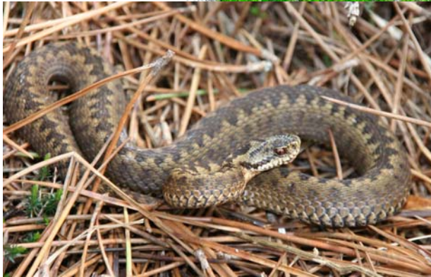
Vipera berus , Antony Hannok