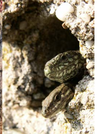
Podarcis muralis , Valérie Tortel